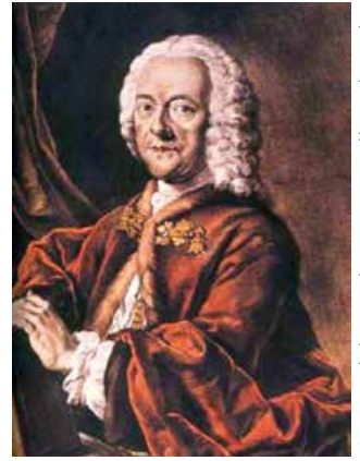
Georg Philipp Telemann

Am „Hochfest der ohne Erbsünde empfangenen Jungfrau und Gottesmutter Maria“ am 8. Dezember singt der Stiftschor um 10.00 Uhr in der Stiftskirche die Missa brevis von Giovanni Pierluigi da Palestrina (1525-1594) und Marienlieder (op. 61d) von Max Reger (1873-1916).