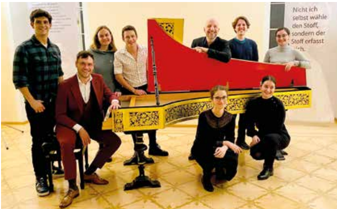
Besuch der Cembalo-Klasse der Kunstuni Graz, Konzert Hemisphärensaal, Museum des guten Tons, 20.10.2023