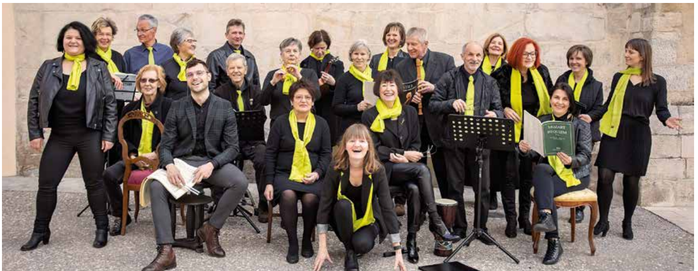
Stiftschor St. Paul

Zur feierlichen Adventskranzsegnung am Samstag, den 2. Dezember um 16.00 Uhr wird es eine besonders schöne und zu Herzen gehende Kooperation des Schulchores des Stiftsgymnasiums mit dem Stiftschor St. Paul geben, bei welcher vier der Christmas Carols von John Rutter (*1945) erklingen werden.