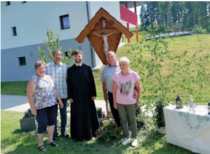
Kreuzeinweihung vlg. Liaschnig