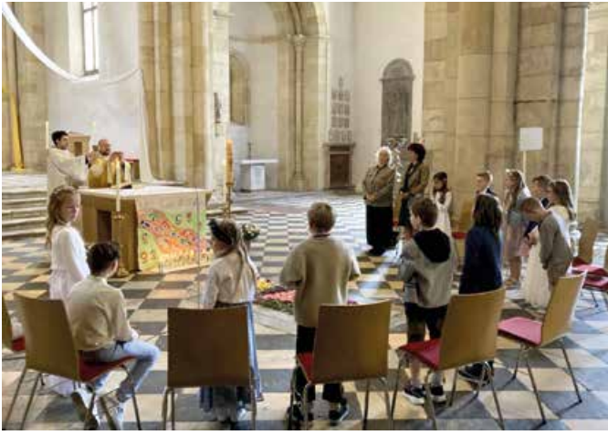
Erstkommunion im Kloster St. Paul