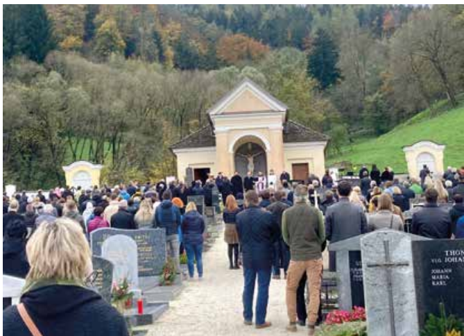
Allerheiligen – Friedhof St. Paul