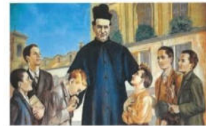
Hl. Don Bosco, du Freund und Schutzpatron der Jugend bitte für uns!