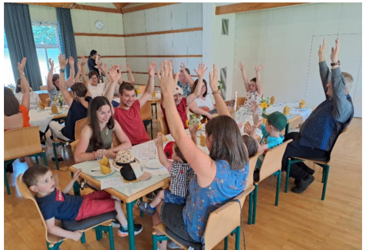
Im Jahr 2022 wurde in der Stadtpfarre Bad St. Leonhard 33 Kindern das Sakrament der Taufe gespendet. Einige der Tauffamilien sind der Einladung der Pfarre am 18. Juni in den Pfarrsaal gefolgt und erlebten einen bunten Nachmittag mit Gebet, Kaffee und Kuchen, sowie einer Schminkstation und Hüpfburg im Pfarrhofgarten.