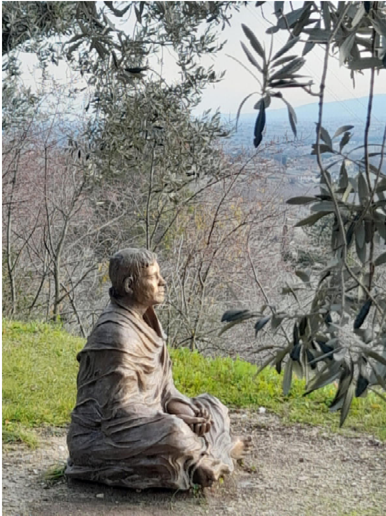
Der Hl. Franz von Assisi