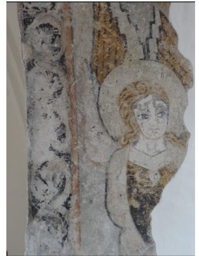
Engelfresko Pfarrkirche Prebl