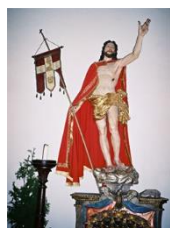
Foto: Der auferstandene Christus mit Osterfahne, Stiftskirche St. Ulrich, Augsburg.

Ostern ist der Höhepunkt des Kirchenjahres. Danke allen, denen die Kirche und eine lebendige Pfarrgemeinde ein Anliegen ist, wo sich Menschen zum Gebet treffen und Aktionen durchführen und bereit sind, Menschen in Not zu helfen. Danke, allen, die mithelfen, das Reich Gottes auch in der Pfarre aufzubauen. Gott segne und stärke euch und schenke euch Freude am Glauben! Ich bitte auch um das Gebet um Priester und Ordensberufe, um das Gebet für die Priester und Seelsorger, für die Kranken, für die Familien und für alle, die bereit sind, weiter im Pfarrgemeinderat und in der Pfarre mitzuarbeiten. Gott segne dich und alle Leser dieses Pfarrboten. Gott der Vater, der Sohn und der Heilige Geist +++