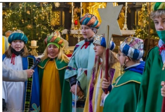
Sternsinger am 6. 1. 2022 bei der Hlg. Messe