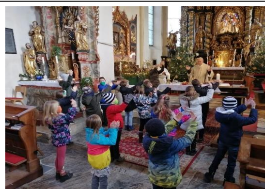
Vorstellung der Erstkommunion-Kinder 2022, die Kinder singen das Vaterunser.

Sternsingergruppen der Pfarre Maria Rojach am 6. 1. 2022 bei der Hlg. Messe