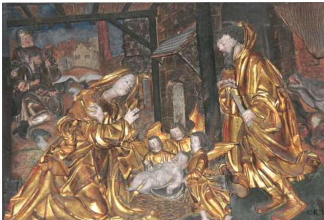
Spätgotischer Flügelalter Pfarrkirche Ma. Rojach (1520).

Botschaften der Weihnacht zur Geburt Jesu