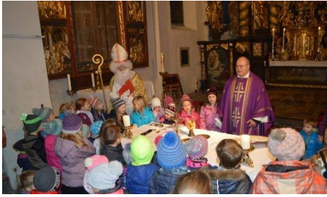
Nikolaus-Messe in Maria Rojach