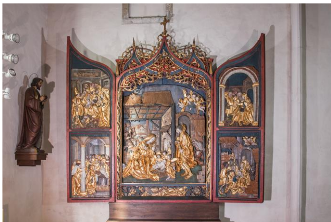
Spätgotischer Flügelaltar Maria Rojach (16. Jh.)

Im Jahre 2020 wurde die kleine Stahlglocke der Fialkirche Gemmersdorf übergeben. Für die Pfarrkirche wurden zur historischen Bronzeglocke (1783) noch drei weitere Glocken angeschafft, es wurde der Glockenstuhl saniert und gefestigt, die große Stahlglocke wurde am Turm belassen und kann zu einem späteren Zeitpunkt ausgetauscht werden, Kosten der drei Glocken mit Sanierung des Glockenstuhls ca. Euro 80.000, eine fünfte Glocke ca. 1000 kg würde derzeit ca. Euro 40.000 kosten.