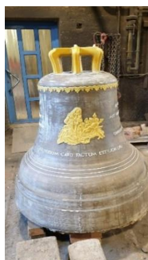
Marienglocke mit dem Motiv spätgotischer Flügelaltar Ma. Rojach