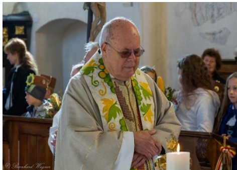
Erntedank 2019

Die letzten Tage vor den Ferien bedeuten manchmal erhöhtes Arbeitspensum. Dieses und jenes soll noch erledigt werden, bevor man eine Pause macht und vielleicht wegfährt. Diese letzten Tage vor den Ferien bedeuten aber auch erhöhte Dankbarkeit . Wenn die