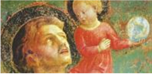
Heiliger Christophorus mit dem Jesuskind

Am So 26. Juli feierten wir in Maria Rojach den Anna-Sonntag und den Christophorus-Sonntag. Wir haben zu einer Fahrzeugsegnung nach dem Gottesdienst um 8.45 Uhr eingeladen Der Anna-Umgang entfiel, wie schon in vorausgehenden Jahren.