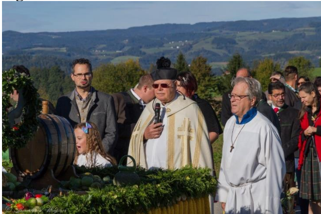
Erntedank 2019 in Maria Rojach

Eine christliche Gemeinschaft von jungen Erwachsenen in einer Pfarre im Südosten von Dublin nahm mich mit auf ihren Weg. Es gab kleine Wanderungen, und manche von uns besuchten die Katechesen der Herz-Jesu-Priester. Wir machten auch einen Ausflug nach Stockholm, der mir trotz der winterlichen Kälte in guter Erinnerung bleibt. Ich durfte hier die christliche Gemeinschaft in Aktion erleben, und somit wuchs auch der Glaube in der Gemeinschaft viel stärker als zuvor als Einzelperson. Hier verstärkte sich der Ruf in mir, mehr für die Kirche tun zu wollen. Ich verdrängte ihn aber weiter.