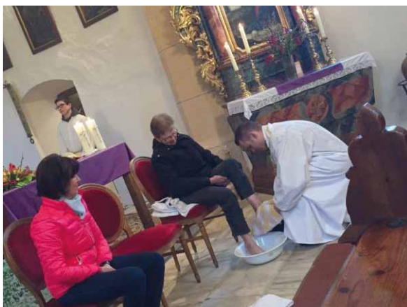
Fußwaschung und Fleischweihe