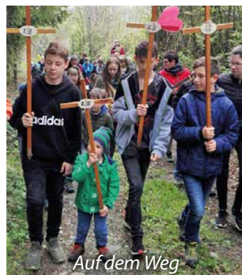
Auf dem Weg

Am Palmsamstag gingen wir gemeinsam mit unserem Herrn Pfarrer, den Erstkommunionkindern den Firmlingen, Mitgliedern der Freiwilligen Feuerwehr, der Jägerschaft und vielen anderen den Weg Jesu von seiner Verurteilung bis zu seinem Tod am Kreuz. Wir beteten