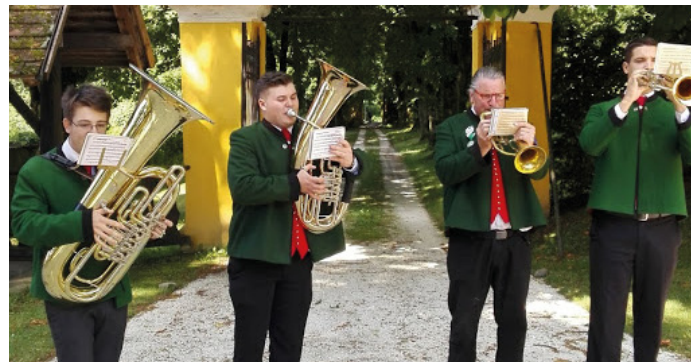
Die Trachtenkapelle spielte beim Fronleichnamstag auf

Im Anschluss wurden beim Feuerwehrhaus 2 neue Einsatzfahrzeuge gesegnet.