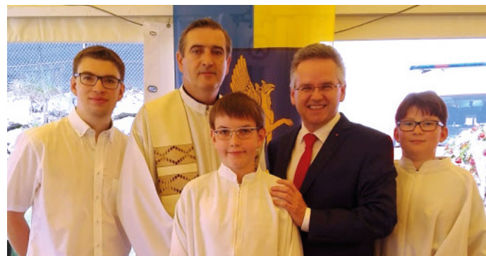
Herr Pfarrer mit Ministranten und dem Herrn Bürgermeister

Im Anschluss wurden beim Feuerwehrhaus 2 neue Einsatzfahrzeuge gesegnet.