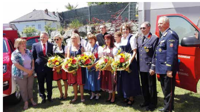
Herr Pfarrer mit Patinnen

Die Hl. Messe und die Prozession am Fronleichnamstag wurde vom Chor des Pfarrverbandes, den Trachtenfrauen, einer Abordnung der Trachtenkapelle Magdalensberg, Männern und Burschen der FF Ottmarnach und vielen Gläubigen feierlich umrahmt. Mädchen und Buben haben sehr gewissenhaft vor jedem „Altar“ Blumen gestreut.