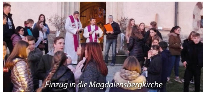
Einzug in die Magdalensbergkirche