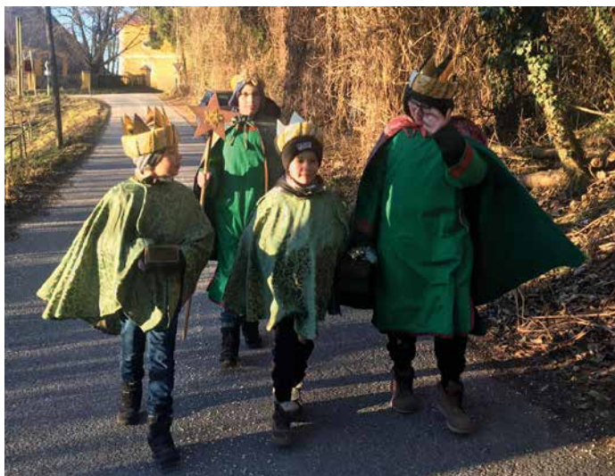
Sternsinger 2019 ohne Schnee