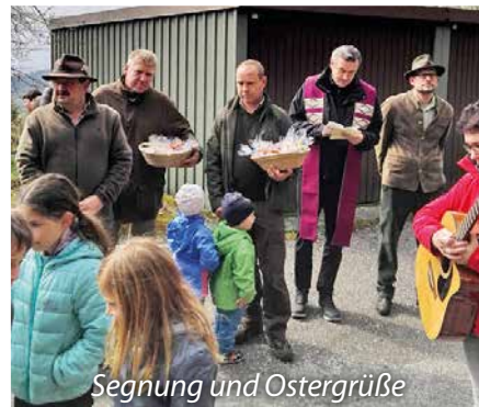
Segnung und Ostergrüße