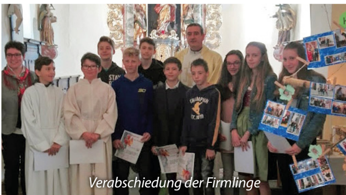
Verabschiedung der Firmlinge