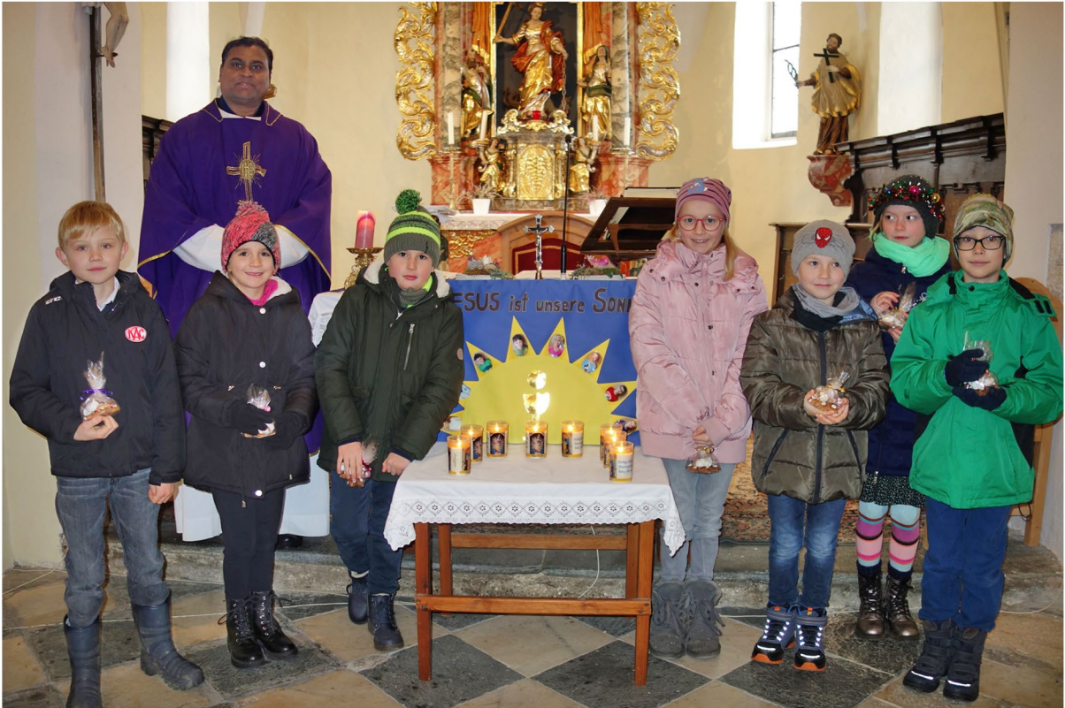
Erstkommunionkinder und Firmlinge