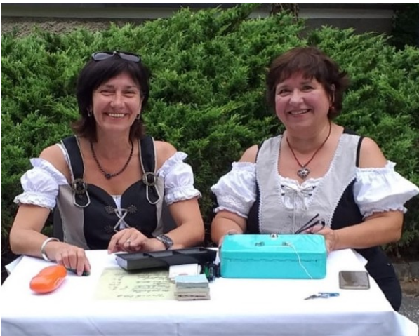
Der Pfarrgemeinderat dankt für Ihre Unterstützung!