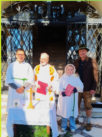
Hubertusmesse am 26. Oktober 2025 Kalvarienberg Althofen