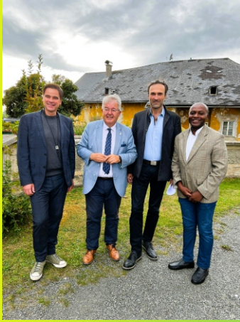
Konzert Sax trifft Orgel am 07. September 2025 PK Althofen