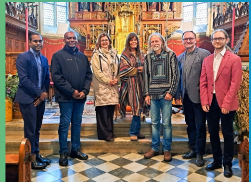
Orgelkonzert am 12. Oktober 2025 PK Althofen