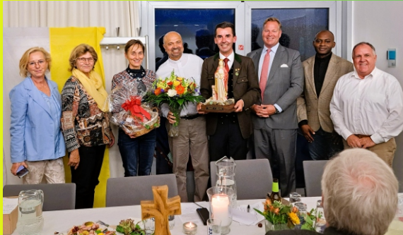
Dekanatsratssitzung 23. September 2025 in Knappenberg