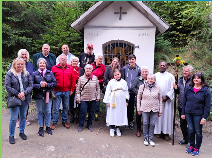
Fatima Wallfahrt am 13. September 2025 nach Maria Waitschach