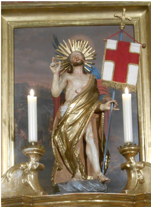
Foto: Auferstandener Herr Jesus - während der Osterzeit am Tabernakel der Pfarrkirche St. Vitus

Lassen wir uns also anstecken von der Osterfreude, welche aus dem Glauben kommt. Seien auch wir Zeugen und Boten des Auferstandenen in unserer Welt! Durch Taufe und Firmung sind wir ausgesandt, den Menschen zu zeigen, dass Christus lebt. Ein neues Licht fällt auf alle Situationen unseres Lebens: Es gibt keine Traurigkeit und keine Schwierigkeit mehr, die nicht in Christus vom österlichen Licht überstrahlt würde. Und wenn es einmal Abschied zu nehmen heißt von dieser Welt, so sterben wir in Christus, um mit ihm beim himmlischen Vater zu leben. Auch unser Leib wird einst auferweckt werden durch die Kraft Gottes. Seine Allmacht und Liebe lässt uns nicht ins Dunkel des Todes fallen, sondern schenkt uns das tröstende Licht seiner Gegenwart.