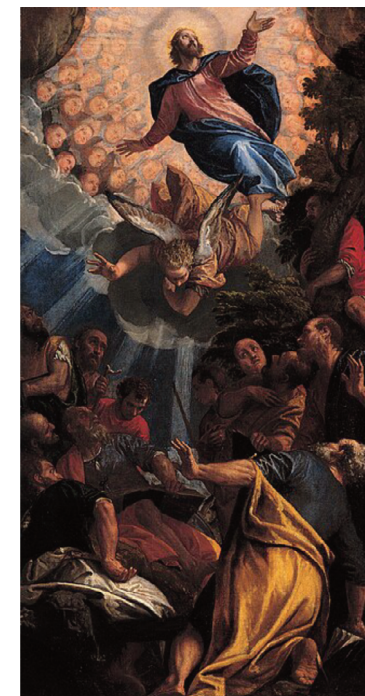
Paolo Veronese – Jezusov vnebohod (1585) – Kapitolski muzeji