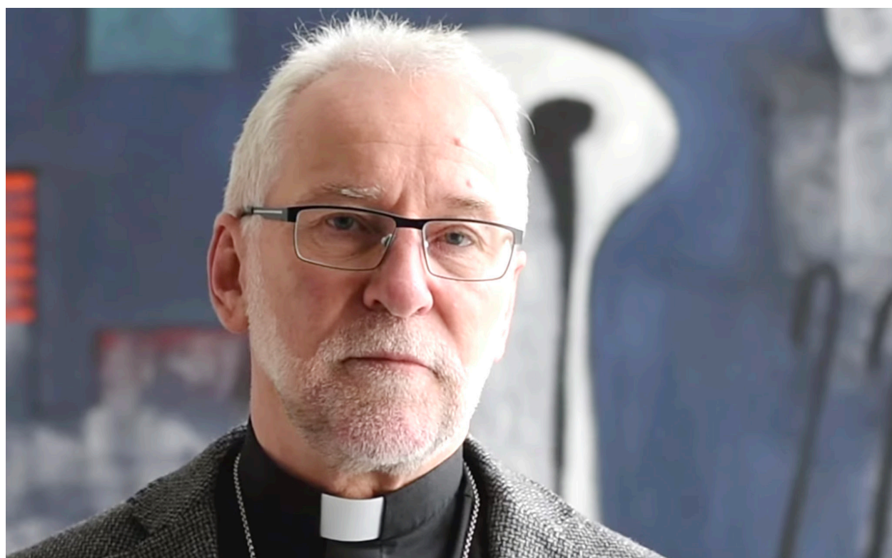
Škof Jože Marketz o smiselnih ukrepih proti širjenju koronavirusa