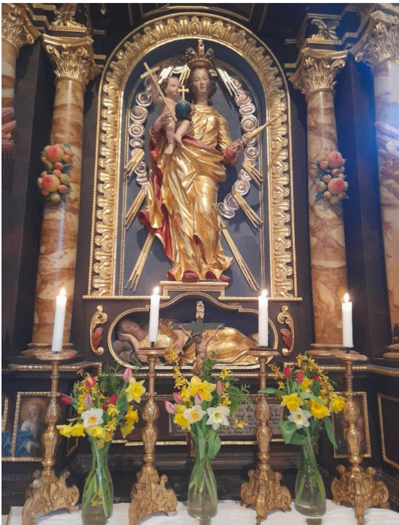
Festlich geschmückter Marienaltar in der Filialkirche Gräbern

„Durch Maria zu Christus“ – Die Kraft des Hl. Geistes möge uns im Pfingst- und Marienmonat Mai begleiten!