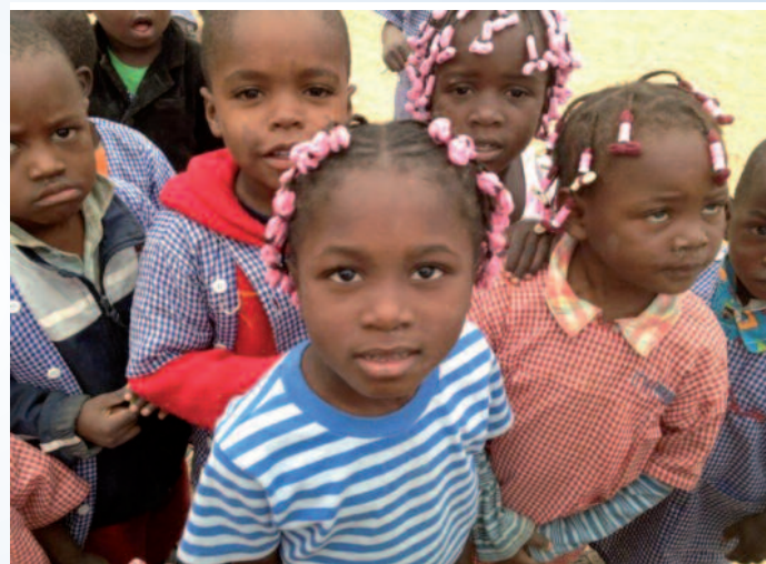
Vrtec misijonskega centra v Bengueli nudi otrokom izobrazbo in zavetišče