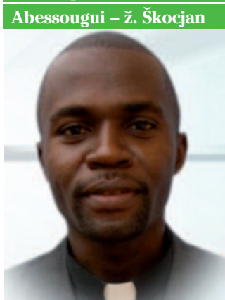
Abessougui – ž. Škocjan