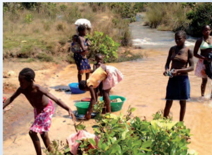
Dragocen vodni vir: Dekleta pri vsakdanjih opravilih ob reki, 20 minut hoda od domače podeželske vasice Moxico Velho. Še kako prav bi prišel vodovod