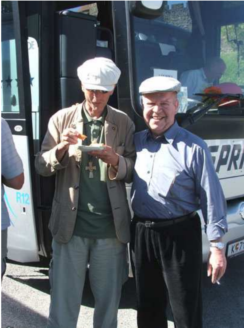
Die zwei Geistlichen plauderten etwas und stärkten sich!