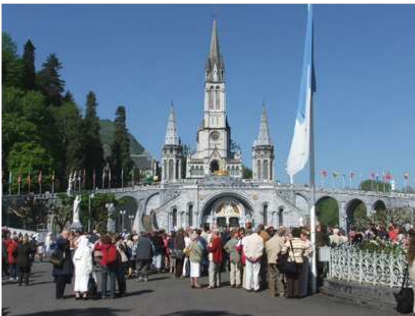
Unser Ziel war am dritten Tage erreicht. Am Abend wurde natürlich das Rosenkranzgebet mit der Lichterprozession noch mitgefeiert und mitgetetet.