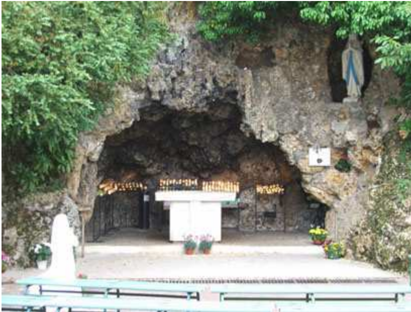
Vor der Kirche eine sehr schöne Lourdesgrotte.