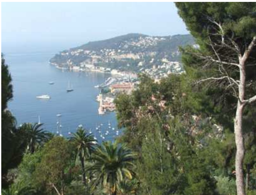
Weiter ging es nach Nizza, wo wir uns für 2 Tage einquartierten. Von Nizza aus besuchten wir Monte Carlo.