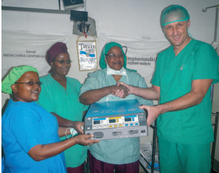
Darilo za varnejše operiranje.

Herniološko združenje Slovenije - Herniološka sekcija pri Slovenskem zdravniškem društvu je letos v sodelovanju s Španskim herniološkim združenjem pripravilo humanitarno misijo »HERNIA INTERNATIONAL« v Tanzaniji.