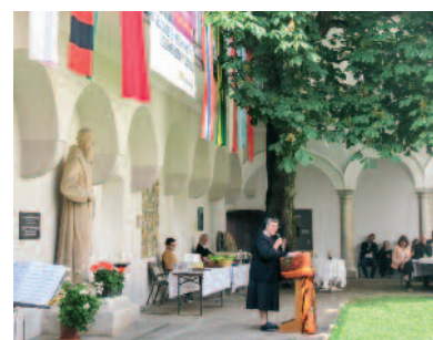
Utrinki s preteklega leta. Tudi letos bo program pester.