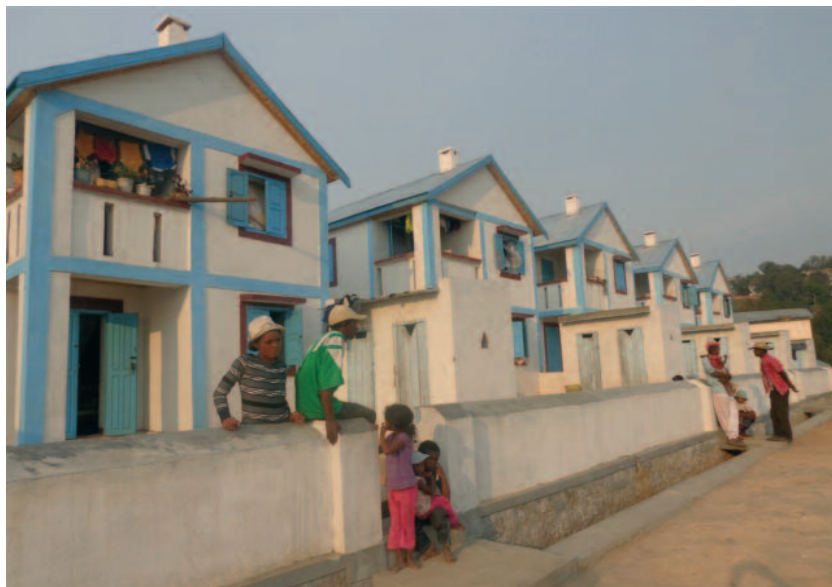
Koroška vas na Madagaskarju raste. Hvala vsem dobrotnicam in dobrotnikom.

Njen dar naj bi bil izraz ljubeče in hvaležne povezanosti s sinom, ki se je po tem koncertu v Afriki smrtno ponesrečil.