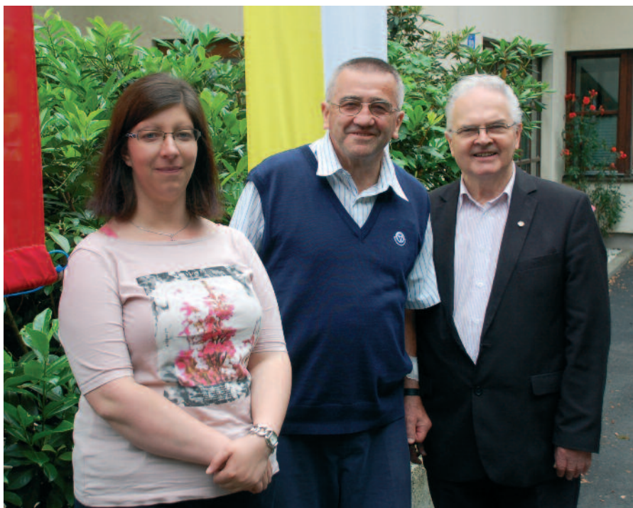
Slovenska misijonska pisarna se veseli obiska misijonarja Mujdrice.

Na šoli naglašujemo, da je treba modro misliti in delati, to bo Bog blagoslovil!