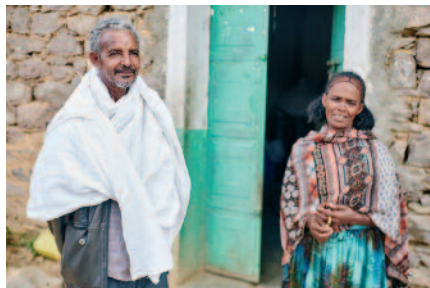
Starša od Hagosa.

S provincialom Estifanosom, prostovoljko Melanesh in dekletom sedimo in pijemo tonik. Na vprašanje, kaj bi želela, ta izpove željo: »Rada bi postala fri-