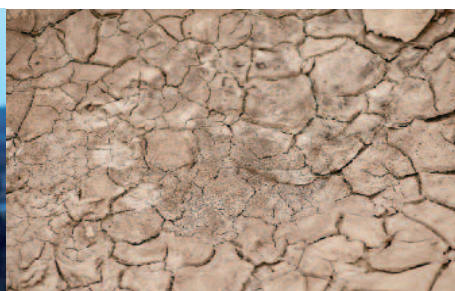
Suša, ki pesti Etiopijo