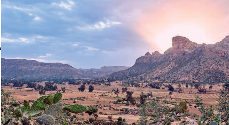
Pokrajina na severu Etiopije