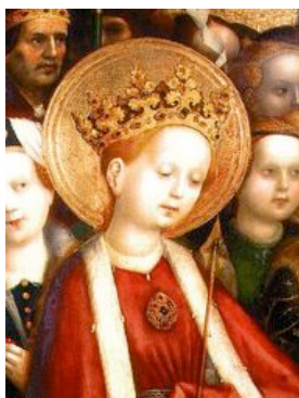
Hl. Ursula I sv. Uršula

Izredno veliko otrok in družin se je udeležilo križevega pota v Šmiklavžu.