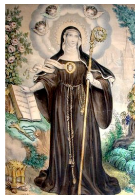
Hl. Gertraud I sv. Jedert