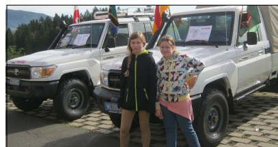
Misijonski praznik na Plešivcu