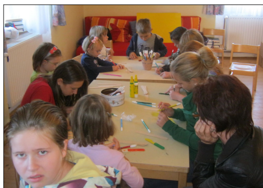
Jungscharnachmittag im Pfarrhof