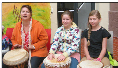
Missionsfest in Tanzenberg