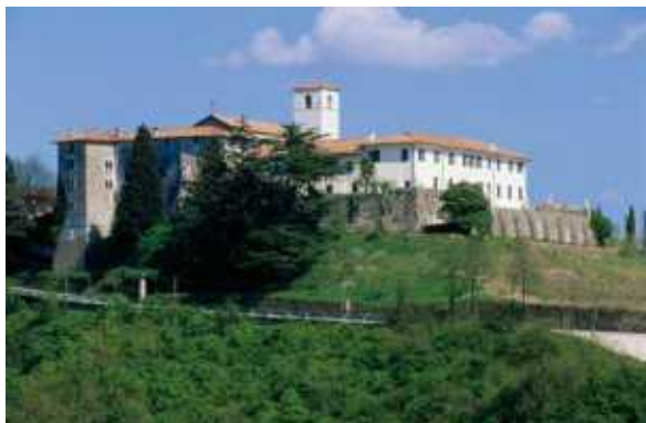
Maibaum der LJ Pölling

Wir planen für heuer auch noch einen Ausflug, für den wir auch gerne Gäste mitnehmen. Datum und Ausflugsziel wird noch bekannt gegeben.