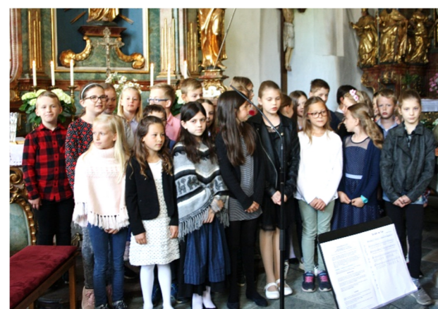
Großartiger Chor der Volksschule