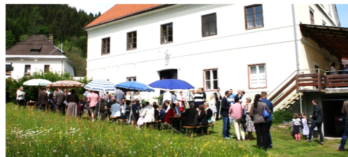
Agape im Pfarrgarten mit den Familien der Kinder