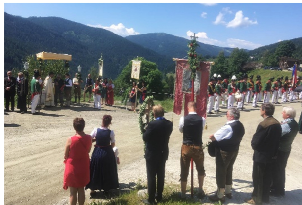
Fronleichnamfest in Außerteuchen