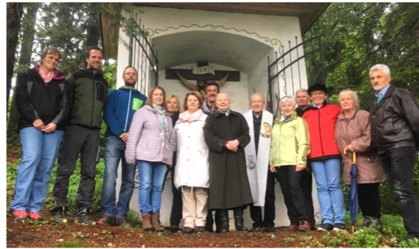
Maiandacht beim Eggelekreuz in Außerteuchen