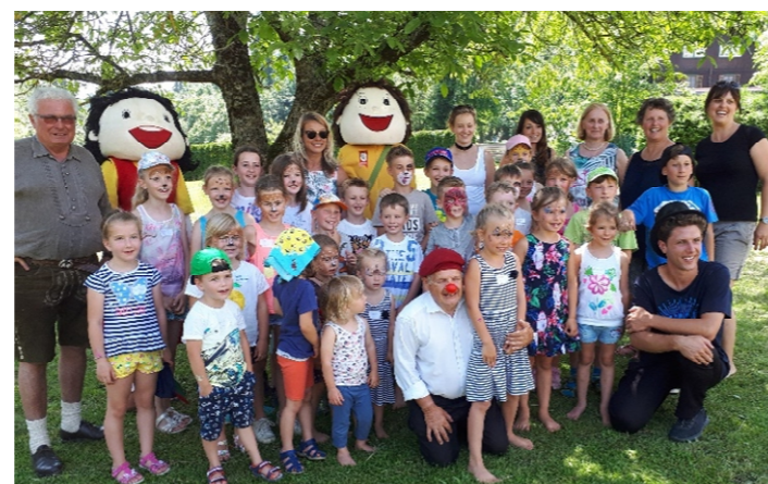
Großes Kinderfest mit tollen Erlebnissen