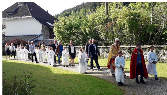
Einzug zur Erstkommunion 2019