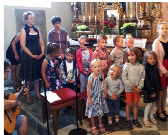
Singgruppe am Dreifaltigkeitssonntag