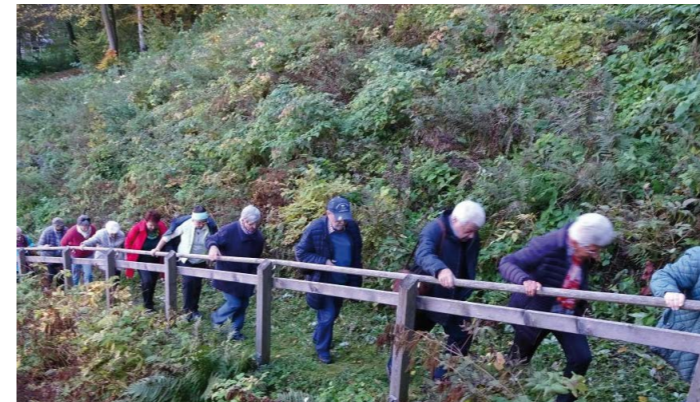
Auf dem Weg zur Kreuzkapelle