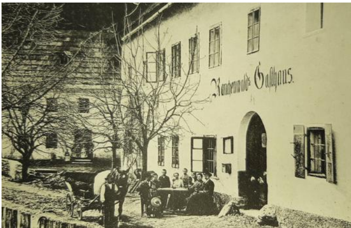
Gasthaus Rauchenwald vlg. Weinwirth 1907

Nach der Präsentation kann es zum Preis von 21,90 EUR auch erworben werden. Da es sich um eine limitierte Auflage handelt, empfehlen die Autoren und der Herausgeber, das Buch vorab per E-Mail unter tiffnerhof@gmx.at oder unter 0664 / 12 04 149 zu reservieren. Das Buch kann dann außerdem entweder beim Rauchenwald, in der Bibliothek Bodensdorf oder nach dem Gottesdienst in der Pfarrkirche abgeholt werden. Nähere Informationen zu den Zahlungsbedingungen und dem Abholungsort erhalten die Interessierten mit ihrer Reservierungsbestätigung.