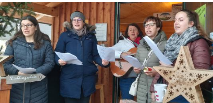
Die Singgruppe Voices vor der Biohütte Tauchhammer