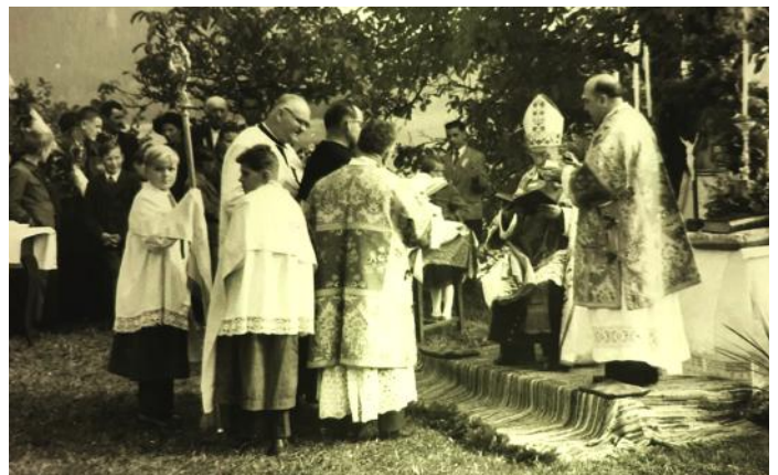
Glockenweihe 1957 - anwesend war neben dem Tiffner Pfarrer Alois Palle auch der damalige Bischof Joseph Köstner († 1982)