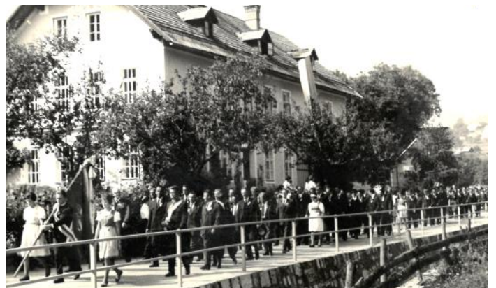
1963 - der MGV Tiffen feiert sein 40. Jubiläum

Heuer feiert der MGV Tiffen, der immer wieder auch unsere kirchlichen Feste musikalisch umrahmt, sein 100-jähriges Bestehen. Aus diesem Anlass findet am Sonntag, den 21. Mai um 10.00 Uhr ein Festgottesdienst in unserer Pfarrkirche statt. Im Anschluss ziehen wir gemeinsam zum Dorfgemeinschaftshaus, wo dann ausgiebig das Jubiläum gefeiert werden soll.