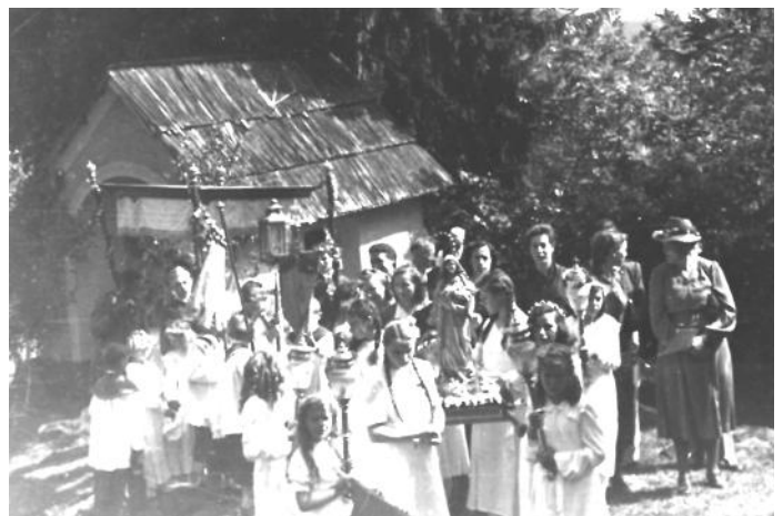
Fronleichnam in der Nachkriegszeit am Georgikreuz