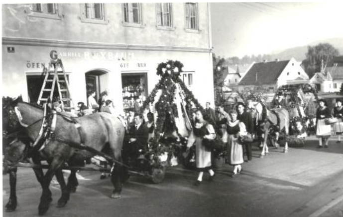
Glockenweihe 1957 - die Glocken wurden damals vom Bahnhof Feldkirchen mit dem Pferdewagen in einem feierlichen Umzug nach Tiffen transportiert