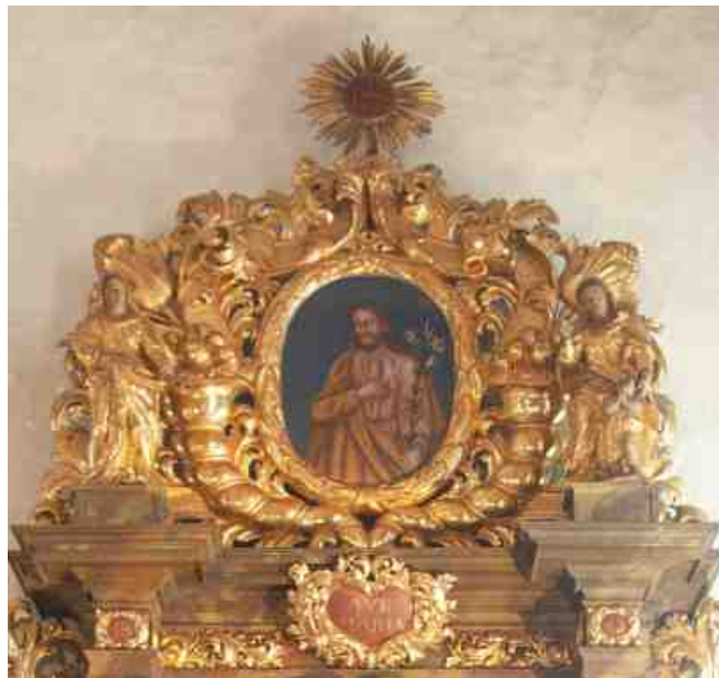
Altarauszug mit dem heiligen Josef auf dem Marienaltar (rechter Seitenaltar), errichtet 1710