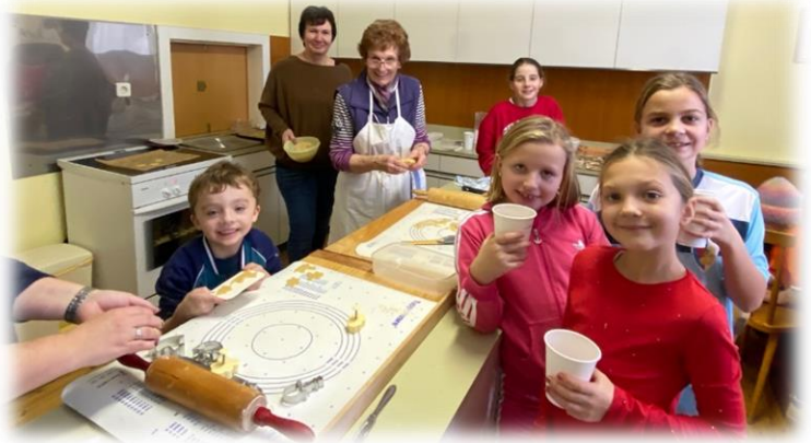
Bei der vorweihnachtlichen Kinderstunde am Samstag, 17. Dezember 2022 erfüllte der Duft von selbst gebackenen Keksen das Pfarrheim.

Der Höhepunkt des Kinderstundenjahres war die feierliche Kindermesse am 24. Dezember um 16.00 Uhr mit musikalischer Einstimmung durch die Schüler:innen der Musikschule. Aufgrund der vielen krankheitsbedingten Ausfälle schlüpfen einige Kinder beim Krippenspiel in mehrere Rollen.