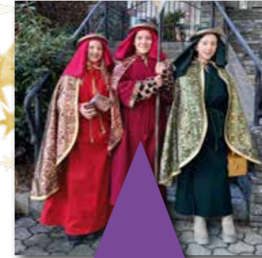
Aus erster Hand

Heuer war es wieder so weit. Nach 2 Jahren coronabedingter Pause durften wir Sternsinger wieder von Haus zu Haus gehen. Der 2. Jänner, schon Fixtermin für uns Sternsinger, ist im Kalender rot markiert. Mit Hilfe von Frau Brigitte erlernten wir das Sternsingerlied mit dem dazugehörigen Text. Voller Tatendrang marschierten alle 6 Gruppen am 2. Jänner und sammelten Geld für das Entwicklungsprojekt. Im Namen aller Sternsinger bedanken wir uns für die freundliche Aufnahme und große finanzielle Spende hier in Greifenburg.