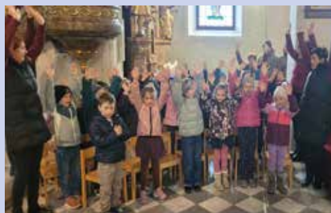
... die Krabbel- messe 2026 in Grbg