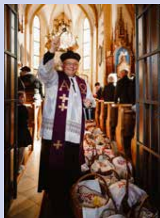
... die Fleischweihe 2026 in Waisach