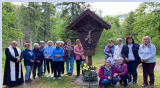
... die Maiandacht 2026 beim Schmoll Kreuz