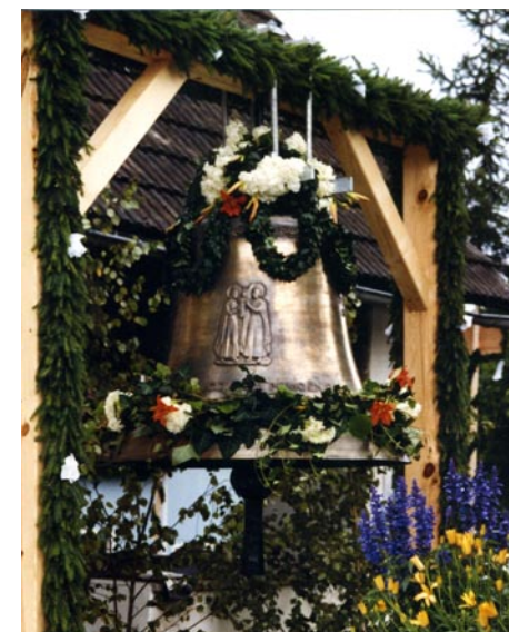
Zvon, ki so ga leta 2004 namestili v dvorški cerkveni stolp