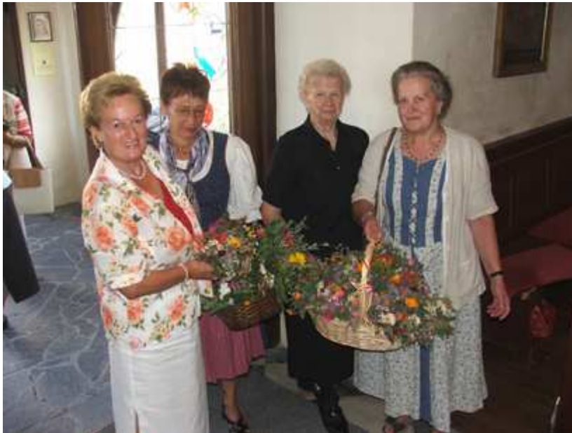
Nach dem Festgottesdienst verteilten die Frauen die Sträußchen an die Gläubigen.