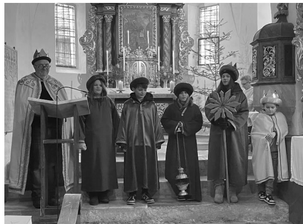
Sternsingerabschluss in Friedlach

Wir bedanken uns besonders bei den Sternsingern (Kinder, Landjugend, Erwachsene), den Begleitpersonen und den Familien, die zum Mittagessen eingeladen haben: