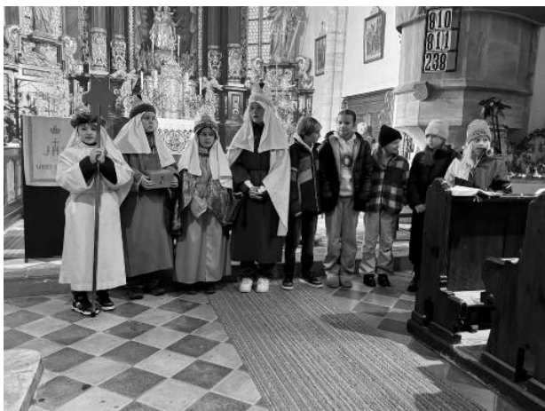
Sternsingerabschluss in Maria Feicht

Weitere Infos und online spenden auf www.sternsingen.at