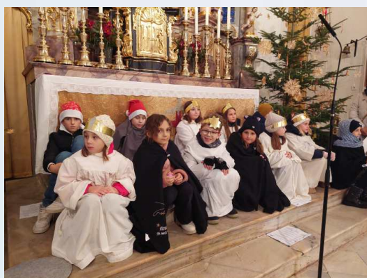
Kinder in Erwartung von Weihnachten in Bleiburg

Die Kindermette in der Stadtpfarrkirche in Bleiburg war auch heuer sehr gut besucht und hat eine besondere Anziehungskraft.