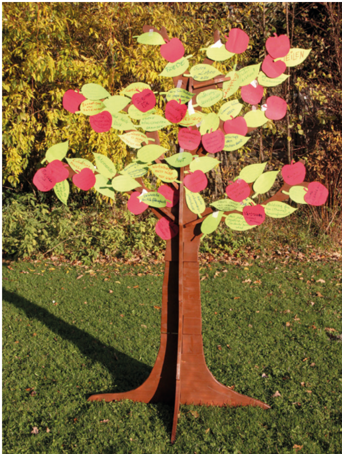
Die Visionen wurden auf Blätter, Blüten und Äpfel angebracht.

dem sie ihre Visionen und Wünsche für den Wandel und „ein gutes Leben für alle“ auf die Blätter notierten und an den Baum klebten. Die Ernte war üppig, denn manch eine*r brachte auch Papieräpfel an – als Zeichen des Wandels, der bereits passiert. „Der Stamm des Baumes, das sind wir. Die Blätter stehen für unsere Visionen und den Weg, die Früchte für die veränderte Welt“, erklärten die Teilnehmer*innen des Symposiums.