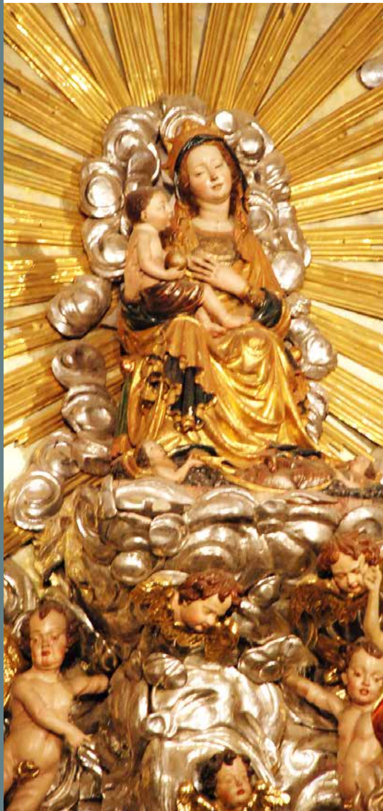
Gospa Sveta: Marija na glavnem oltarju stolnice GOTTHARDT