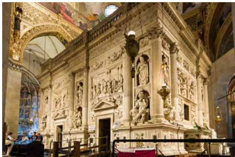
Marijina hiša ali »Sveta hiša« v baziliki