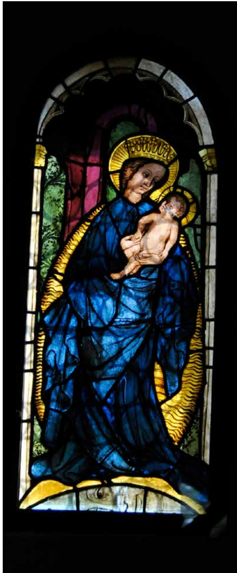
Okno z Marijo v zimski cerkvi na Otoku ob Vrbskem jezeru GOTTHARDT

Človeško življenje – koliko je danes vredno?! Marija, prosi za nas!