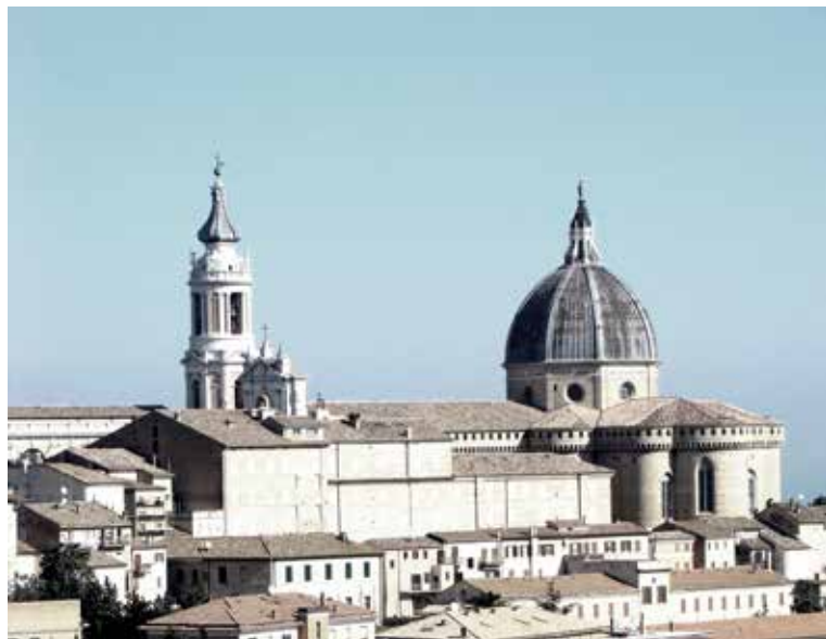
Bazilika Maria Loreto v Italiji

Če hočemo Marijo prav častiti, moramo Boga ljubiti. Če hočemo Boga prav častiti, moramo tudi Marijo ljubiti. Da moremo Boga ljubiti, se moramo poprej zavedati, kako zelo nas on ljubi. S premišljevanjem skrivnosti rožnega venca in vzkliki lavretanskih litanij naj raste naše zaupanje v ljubezen, s katero nas Bog ljubi.