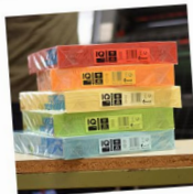
IQ Color - DIN A3, 80g, Färbig, Paket 500 Blatt