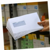
C5-Kuvert, weiß, mit Fenster, mit Halbstreifen, 90g, pro Stück