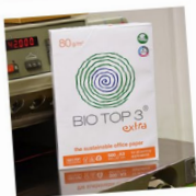
Bio Top 3 extra DIN A3, 80g, naturweiß, Paket 500 Blatt