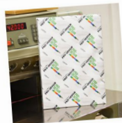
Pro Design - DIN A3, 90g, hochweiß, Paket 500 Blatt