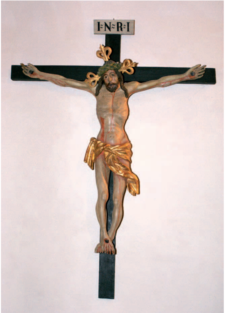
Kruzifixus , Holzskulptur um 1500, Mariahöfl im Metnitztal, Wallfahrtskirche