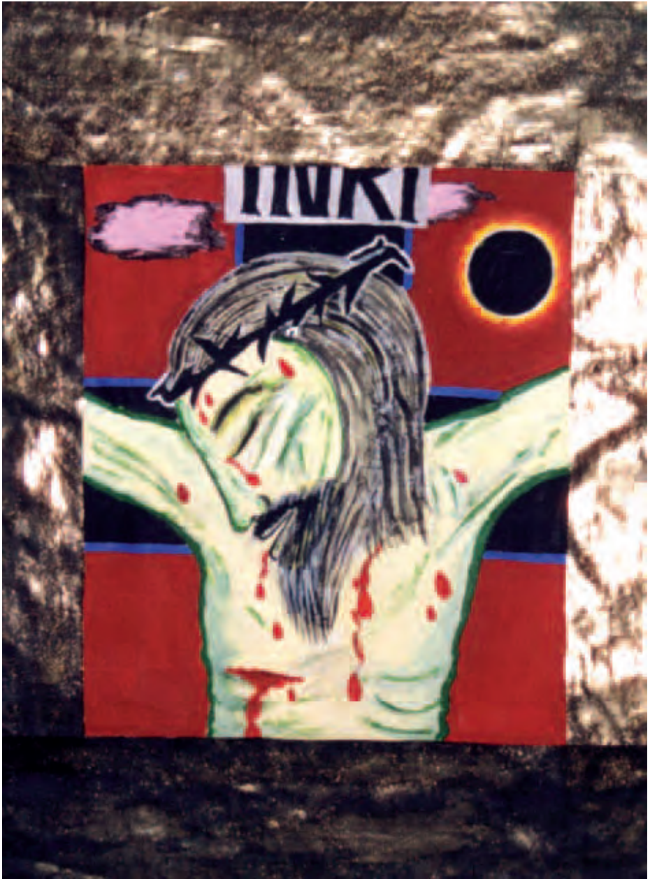
Jesus stirbt am Kreuz , Farbe auf Papierblatt/Leinwand, 1998, Julia Wiegele, Carinthischer Sommer 2000, Ossiach, Pfarr- und ehem. Stiftskirche Maria Himmelfahrt