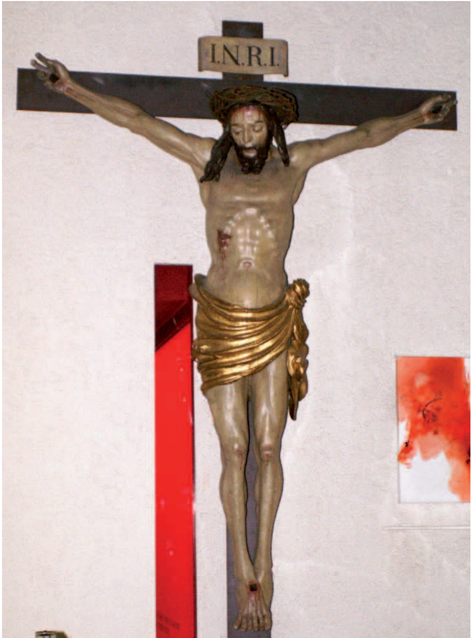
Kruzifixus , Holzskulptur um 1520, Klagenfurt, Welzenegg, Pfarrkirche Herz Jesu