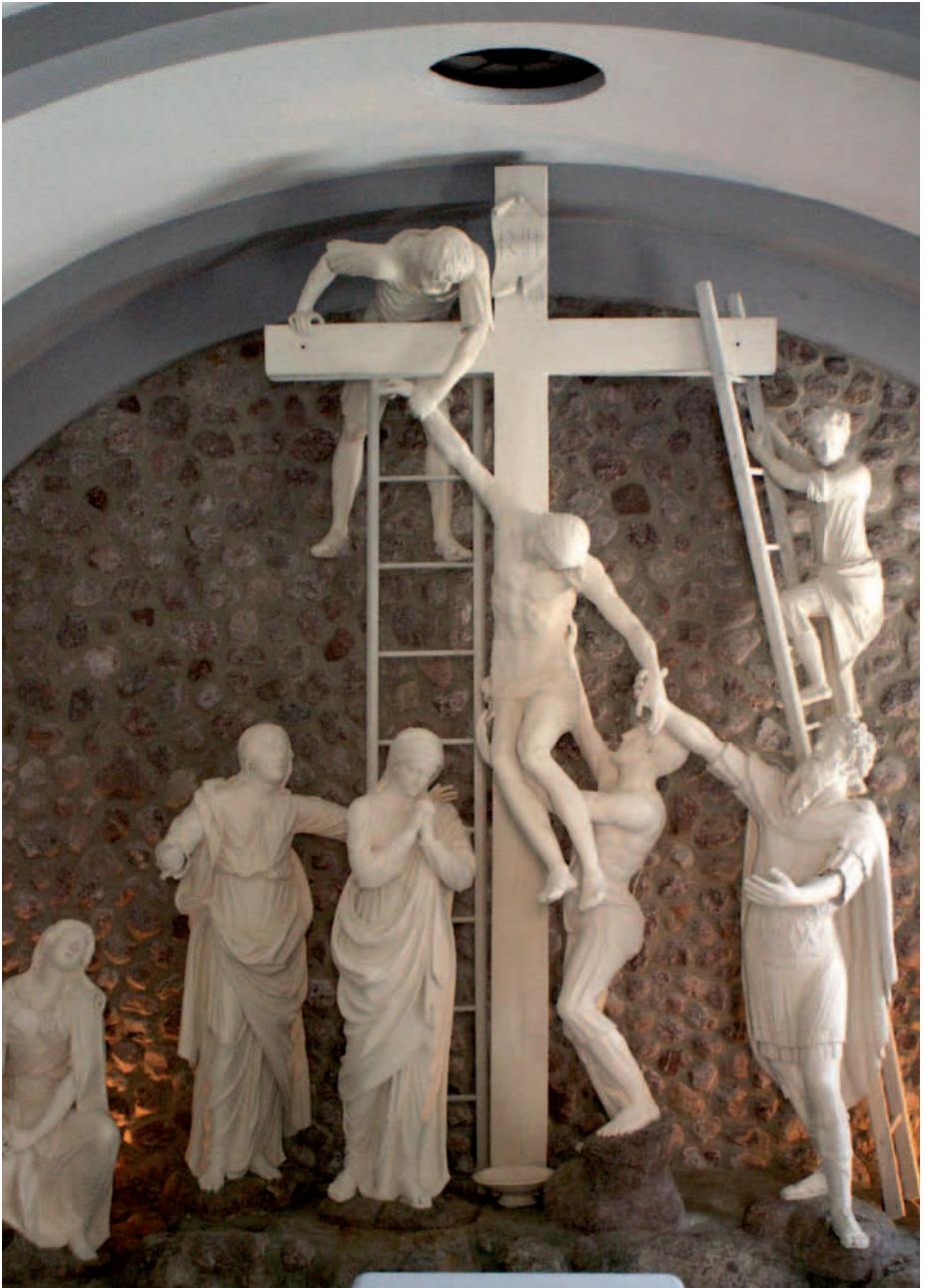
Kreuzabnahme , Holzskulpturengruppe um 1815, Johann Probst, Ossiach, Friedhofskapelle