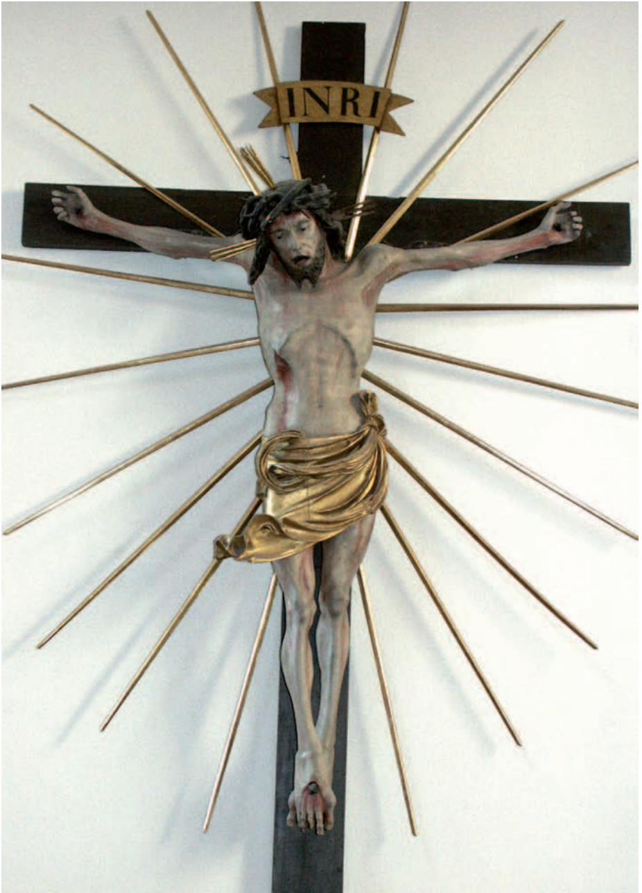
Kruzifixus im Strahlenkranz, Holzskulptur, 1. V. 16. Jh., Feldkirchen, Pfarrkirche Mariä Himmelfahrt (Maria Dorn)