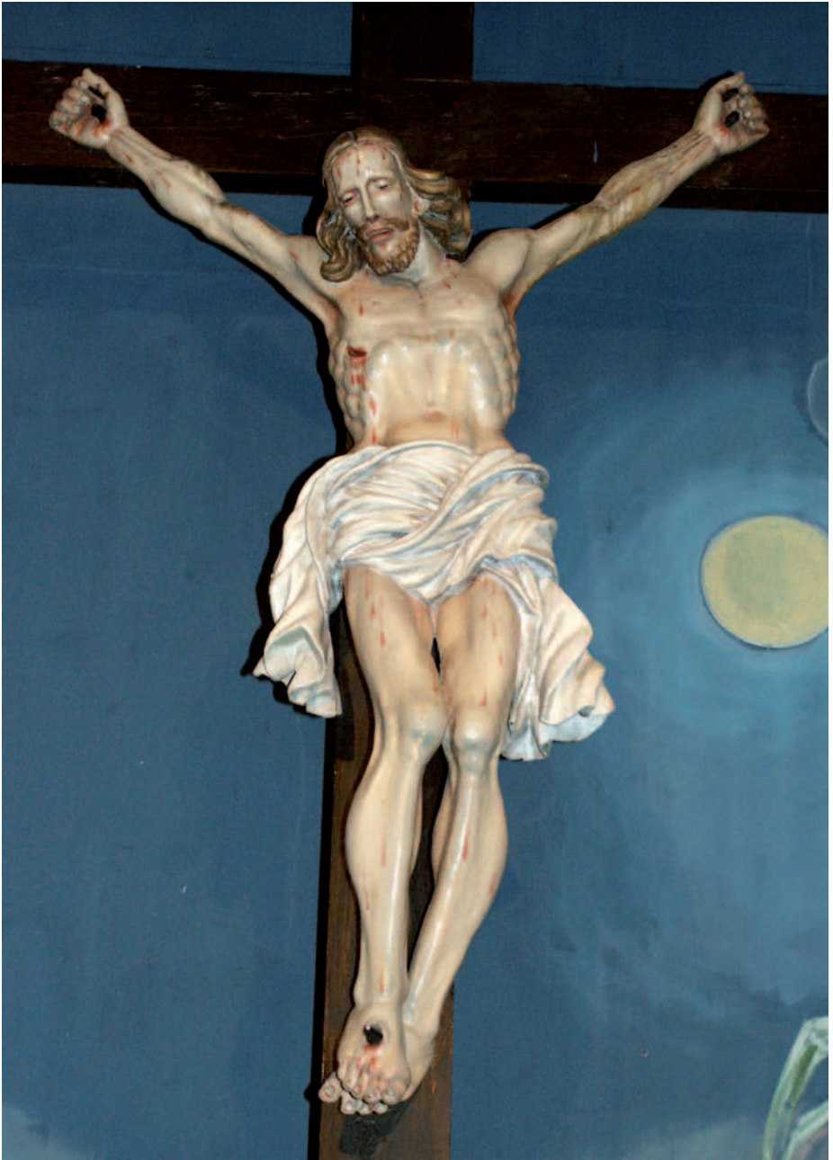
Kruzifixus , Holzskulptur vor gemalter Kulisse, um 1780, St. Stefan im Gailtal, Pfarrkirche