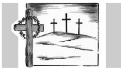
Karfreitag: Im Dunkel des Todes