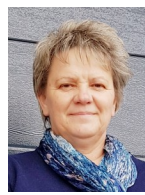
Eder Dorothea Vassacher Straße 57