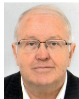
DI Themesl Helmut Borgenstraße 4