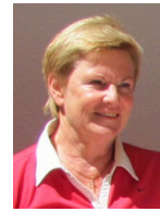
Muralt Sigrid Gritschacher Str. 96