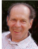
Dorrighi Karl Fr.-Jonas-Straße 24