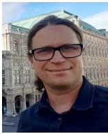
DI Albi Martin Waldheimstraße 5

Als Kandidaten und Mitarbeiter der Pfarre haben sich zur Wahl bereit erklärt und sind durch Ihre Stimme gewählt worden: