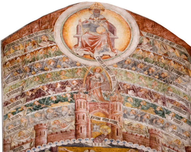
Fresko von Thomas von Villach in der Andreaskirche

Neun Stufen von "Heiligen Heerscharen", Hierarchien, werden von denen geschildert, die entsprechenden Einblick haben, oder drei Hierarchien, die sich in je drei "Chöre" gliedern; erst über diesen thront der Dreifaltige Gott.