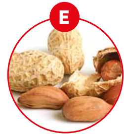
E ERDNÜSSE UND DARAUS GEWONNENE ERZEUGNISSE