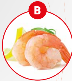
B KREBSTIERE UND DARAUS GEWONNENE ERZEUGNISSE