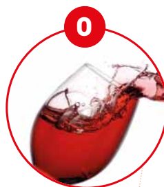
O SCHWEFELDIOXID UND SULFITE