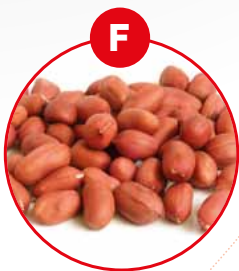
F SOJABOHNEN UND DARAUS GEWONNENE ERZEUGNISSE