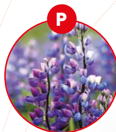
P LUPINEN UND DARAUS GEWONNENE ERZEUGNISSE