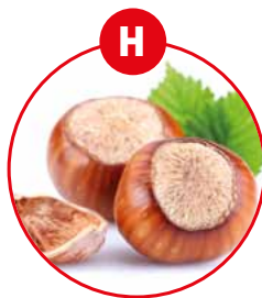
H SCHALENFRÜCHTE UND DARAUS GEWONNENE ERZEUGNISSE