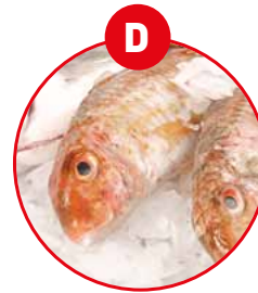
D FISCH UND DARAUS GEWONNENE ERZEUGNISSE (AUSSER FISCHGELATINE)