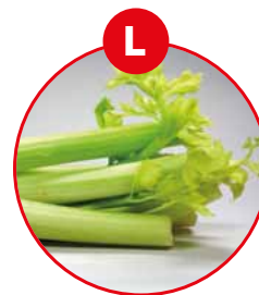
L SELLERIE UND DARAUS GEWONNENE ERZEUGNISSE