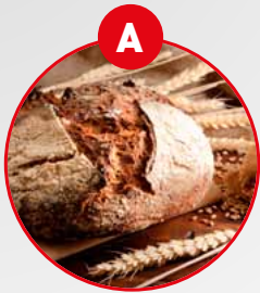
A GLUTENHALTIGES GETREIDE UND DARAUS GEWONNENE ERZEUGNISSE

Allergeninformation gemäß Codex-Empfehlung