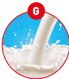
G MILCH VON SÄUGETIEREN UND MILCHER- ZEUGNISSE (INKLUSIVE LAKTOSE)