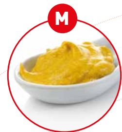
M SENF UND DARAUS GEWONNENE ERZEUGNISSE