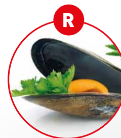
R WEICHTIERE WIE SCHNECKEN, MUSCHELN, TINTENFISCHE UND DARAUS GEWONNENE ERZEUGNISSE