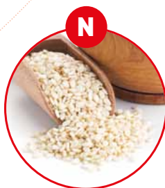
N SESAMSAMEN UND DARAUS GEWONNENE ERZEUGNISSE