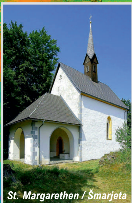
St. Margarethen / Šmarjeta