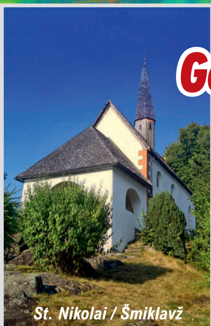
St. Nikolai / Šmiklavž