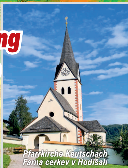
Pfarrkirche Keutschach Farna cerkev v Hodišah