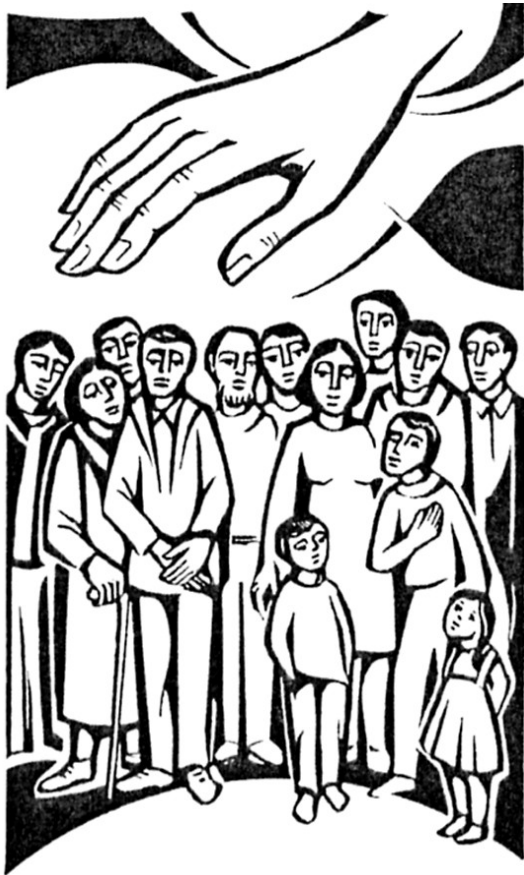
Dieses Bild möchte angemalt werden