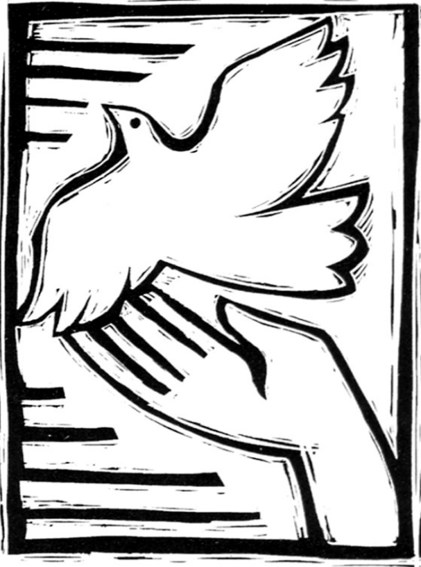
Dieses Bild möchte angemalt werden

22. 5. 2022 6.Sonntag der Osterzeit C Joh 14,23-29