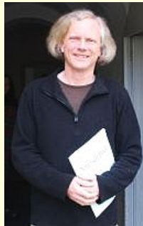
Konrad Junghänel dirigierte die Bach-Kantaten

Höhepunkt des Festivals KULTUR.RAUM.KIRCHE war das Konzert am Samstag, dem 3. Mai , mit drei Kantaten von J.S. Bach, zum gegenwärtigen Zeitpunkt des Kirchenjahres ausgewählt, und dem Auftragswerk "Salve Regina" von Ch. Flöré.