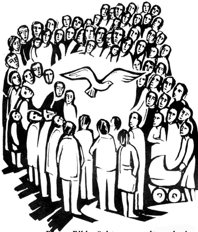
Dieses Bild möchte angemalt werden!

In jener Zeit, als Judas hinausgegangen war, sagte Jesus: Jetzt ist der Menschensohn verherrlicht, und Gott ist in ihm verherrlicht. Wenn Gott in ihm verherrlicht ist, wird auch Gott ihn in sich verherrlichen, und er wird ihn bald verherrlichen. Meine Kinder, ich bin nur noch kurze Zeit bei euch. Ein neues Gebot gebe ich euch: Liebt einander! Wie ich euch geliebt habe, so sollt auch ihr einander lieben. Daran werden alle erkennen, daß ihr meine Jünger seid: wenn ihr einander liebt.